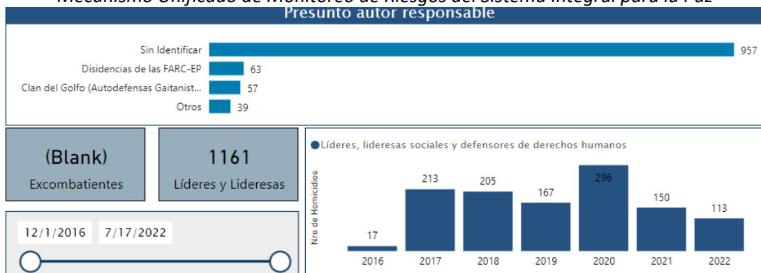
Ilustración 3. Reporte de líderes sociales asesinados entre 2016 y 2022 a la JEP, Tomado del Mecanismo Unificado de Monitoreo de Riesgos del Sistema Integral para la Paz

Como lo muestra la ilustración 3 la mayor parte de los presuntos autores responsables de dichos asesinatos aún se encuentran sin identificar. Se supone que el periodo seleccionado es el posterior a la firma del acuerdo de paz. Estas víctimas deben ser recordadas por esta generación para evitar que este genocidio continúe. Además, permite que los estudiantes comprendan cuáles son las causas que defienden estas personas, los territorios que están en disputa y los posibles presuntos actores involucrados en esos crímenes.