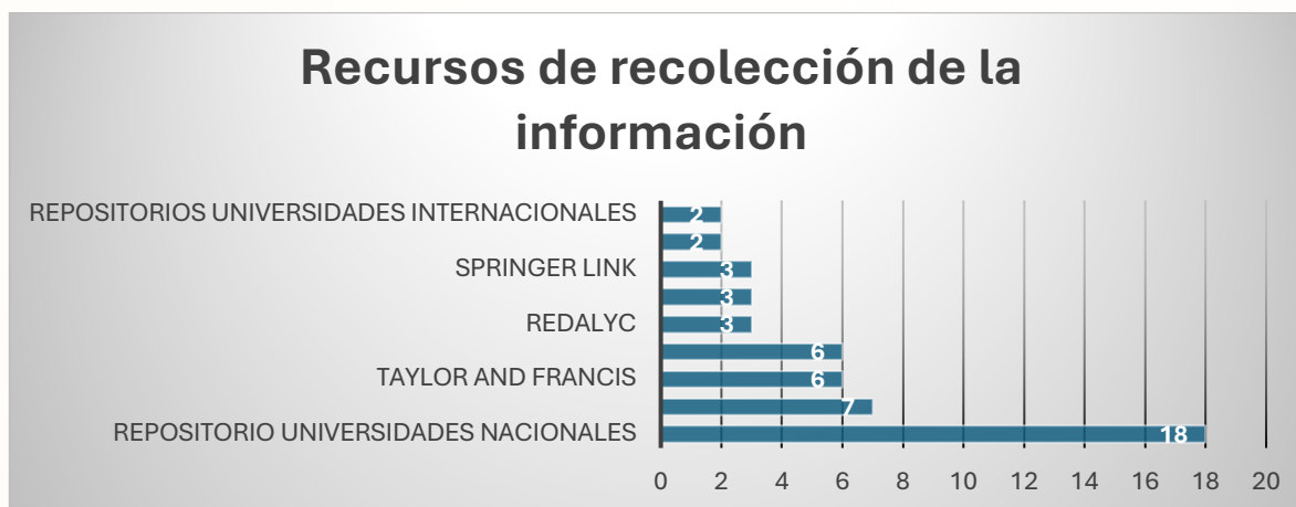
Figura 3 Número de documentos de investigación recopilados según bases de datos académicas

La revisión de investigaciones de universidades nacionales buscó priorizar el conocimiento de estudios recientes y pertinentes al ámbito colombiano. Para ello, la búsqueda en bases de datos académicas —en especial en los repositorios de universidades colombianas— fue propicia para mapear y delimitar las discusiones que, en torno a la escuela, la ciudadanía y lo socioemocional, se han desarrollado en el país. Como se ha señalado, se evidenció que, en los últimos años, la mayoría de estas investigaciones se han centrado en el papel de la subjetividad política y en la formación ciudadana.